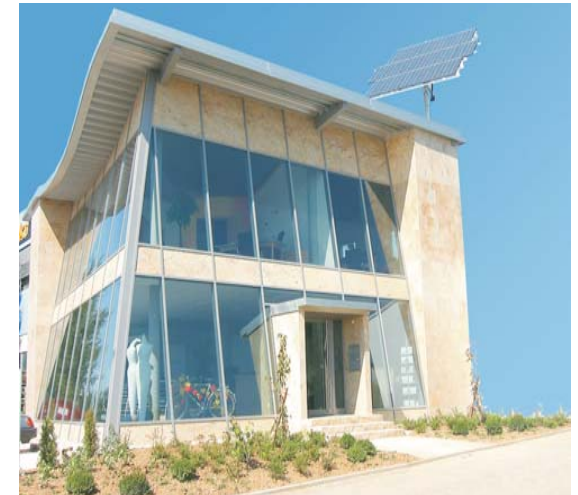
Firma Bauer in Wolfschlugen 2x 2KW Anlage mit 32 Solar-Elementen