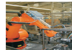
Bestückungsroboter in der Motorenfertigung