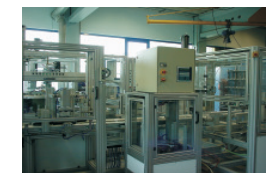
Anlage zur Herstellung von Video- u. DVD-Verpackungen