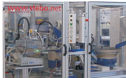
Montageanlage - Ansaugventil